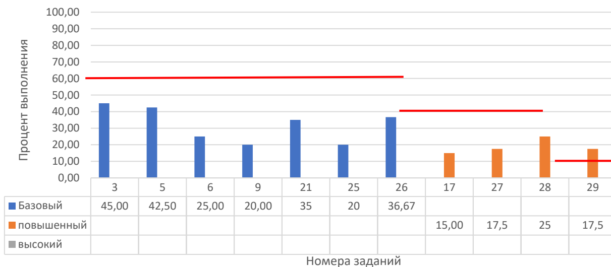
Рисунок 2. Задания, по которым участники не преодолели минимальный порог

На рисунке 2 представлены данные по заданиям (%), уровень выполнения которых не преодолел минимальный порог. Красной линией отражен минимальный порог выполнения для каждого уровня сложности: базовый – 60%, повышенный – 40%, высокий – 10%.